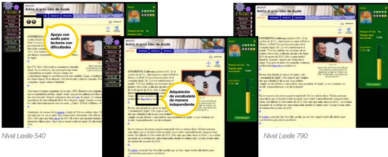
Nivel Lexile 540

Nuestras soluciones diferenciadas en línea para los grados del 2.º al último de bachillerato les brindan a los maestros los medios necesarios para instruir a cada estudiante justo en su nivel individual. Al asignarle la misma tarea a cada estudiante en su nivel específico de lectura, Achieve permite que todos los estudiantes participen activamente y con éxito en las actividades y debates en el salón de clase.